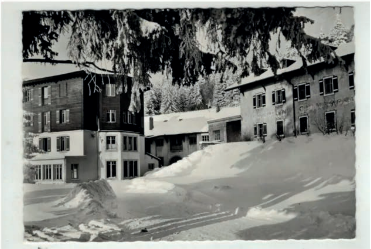
Photo du Monastère de Béthléem des Voirons