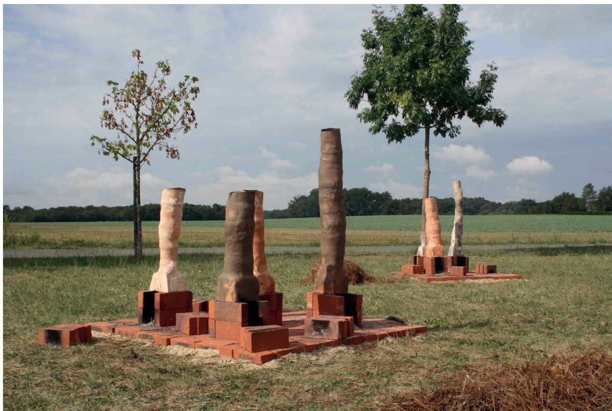
Julie Kieffer, Muktinath 190920 , 2020, Faïence rouge, blanche et noire, sol et four en briques réfractaires, sable, bois, épinettes de pin sèches

En septembre, pour le week-end de clôture, Julie Kieffer activera ses cheminées pour un moment de partage et convivialité