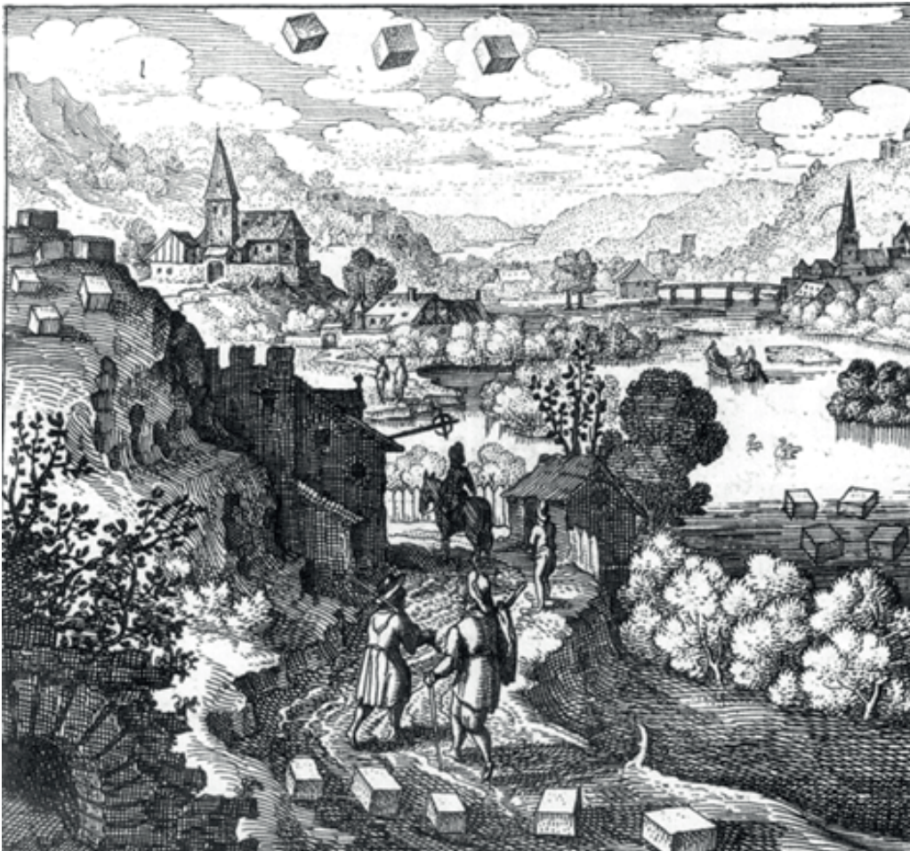
Gravure de l'ouvrage L'Atlante fugitive

La pierre a été projetée à terre et exaltée sur les montagnes ; elle habite dans l'air et se nourrit dans un fleuve est l'énoncé de la trente-sixième gravure de l'ouvrage Atalante fugitive (célèbre ouvrage du XVII e siècle présentant cinquante symboles alchimiques sous forme de gravures) et le titre de cette nouvelle performance conçue pour le week-end d'ouverture de Chemins de crête . Elle se déroulera dans la douceur d'une hêtraie au commencement d'une soirée, la première du mois de juillet. La performance est une danse qui est une marche qui est une trace qui est un rituel. La marche est un chemin, le chemin est un sillon. Les pierres volent haut dans le ciel d'été et les feuilles des arbres jonchant le sol sont des pièces d'or.