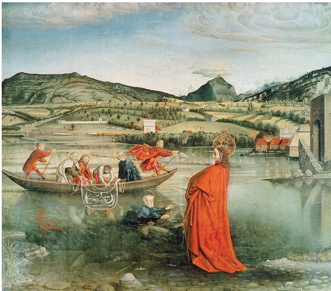
Conrad WITZ, La pêche miraculeuse , 1444, 134.6 × 153.2 cm, Musée d'art et d'histoire de Genève. Première peinture de l'histoire de l'art occidentale représentant un paysage de manière réaliste et conforme à sa topographie naturelle. A gauche, le massif des Voirons.

Ambroise Tièche donnera une lecture de son texte Tribulations d'un Genevois aux Voirons ou : Pédologie, images, imaginaire et orthopédie , lors du Week-end d'ouverture le samedi 1er juillet dans la navette partant d'Annemasse et menant à la crête.