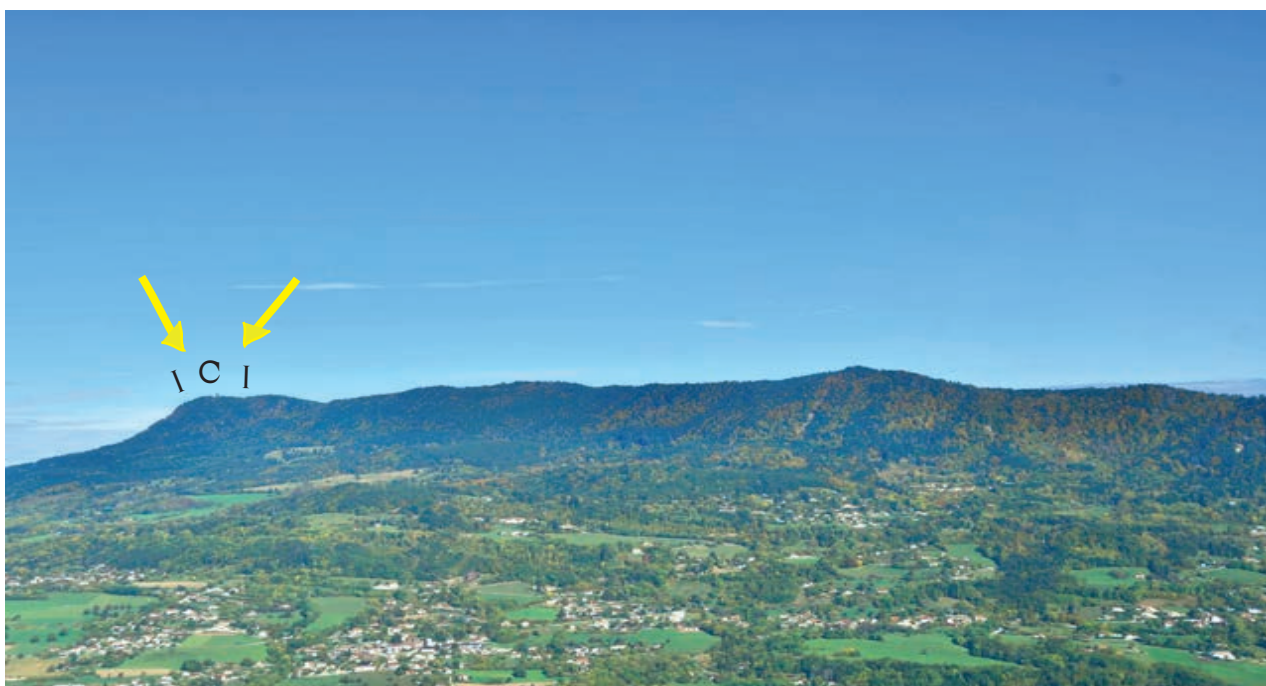
Massif des Voirons et sa crête, vue depuis le chablais

Évènements et ateliers gratuits, en entrée libre SAUF les dégustations culinaires, pour plus d'information consultez notre site internet. Rendez-vous au parking du monastère pour le début de l'atelier. Uniquement sur réservation : resa@villaduparc.org